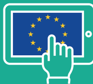
Schéma dávok EÚ:

pomoc a podpora pre osoby, ktoré majú problémy so splácaním dlhov.